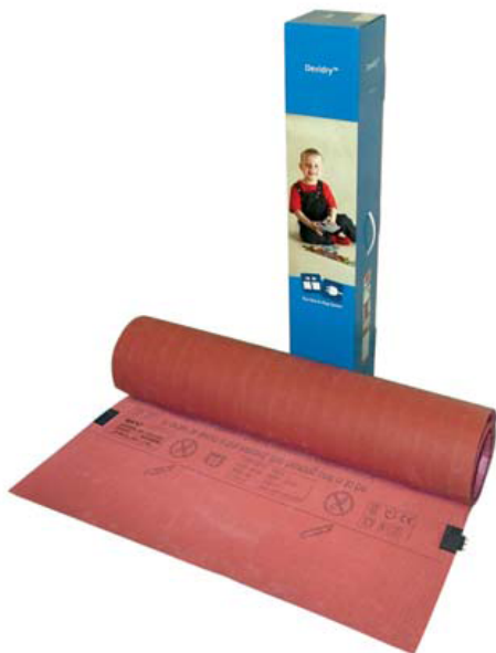
Нагревательный мат DEVIdry™ 100.

Термическое сопротивление покрытия пола не должно превышать 0,125 \text{ м}^2 \text{ К/Вт} .