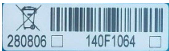
Рис. 1. А. Вид стикера на корпусе терморегулятора.

Б. Вид стикера на упаковочной коробке терморегулятора.