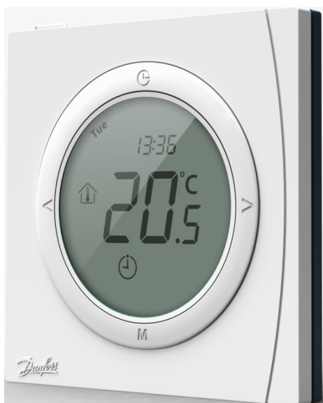
Рис. 2. Терморегулятор электронный EStemp™ Next Plus.

Терморегулятор поставляется в виде готового электронного блока для установки во встроенную в стену монтажную коробку с крепежной базой 60 мм, аналогично электрическому коммутационному оборудованию для скрытой проводки.