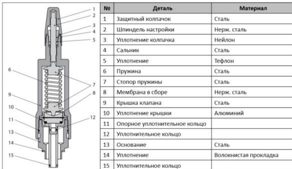
Рисунок 1. Конструкция клапана-регулятора давления CVP