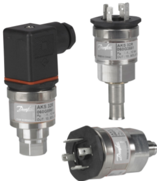
Рис. 1 Внешний вид преобразователя давления AKS 32R