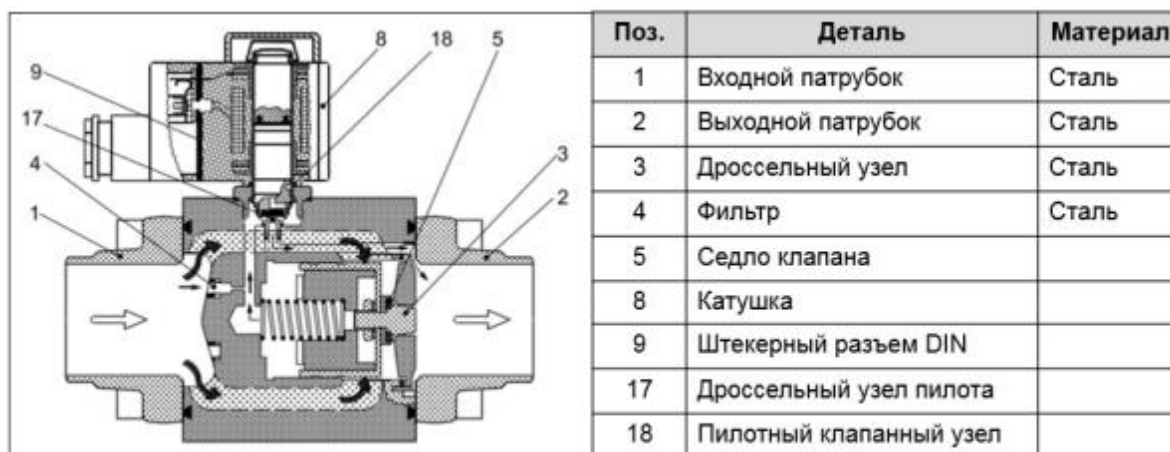
Рис. 1 Конструкция клапанов AKVA 20