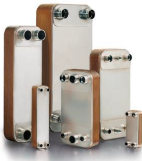
Внешний вид теплообменников пластинчатых типа МРНЕ серии С

Теплообменники пластинчатые типа МРНЕ серии С предназначены для передачи тепловой энергии от одного теплоносителя к другому. Теплообменники пластинчатые типа МРНЕ серии С могут применяться в холодильных установках (компрессорных, абсорбционных), а также в тепловых насосах. В качестве рабочих сред могут использоваться негорючие хладагенты (фторуглеводороды, хлорфторуглеводороды, CO 2 ), технические и холодильные масла, вода для технических нужд и систем ГВС, спиртосодержащие растворы.