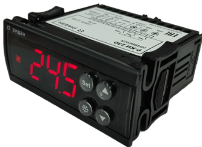
Рис. 1 Внешний вид контроллера

Контроллеры типа Р-КИ управляют холодильным оборудованием на основе заложенной в него программой. Контроллер получает сигналы от датчиков, сравнивает эти показания с параметрами, заложенными в контроллере (уставками) и на основе этого сравнения производит управление (закрывает, размыкает реле). Уставки возможно изменять через дисплей с кнопками управления или по сети ModBus, к которой контроллер подключен при помощи встроенной сетевой карты.