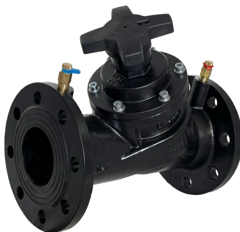
Рис. 1 Общий вид клапана типа MNF, модификация MNF-R

Клапаны балансировочные типа MNF, модификация MNF-R (далее – клапан MNF-R) используются для монтажной наладки трубопроводных систем тепло - и холодоснабжения зданий и сооружений с целью обеспечения в них расчетного потокораспределения.