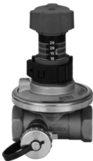
АРТ DN 15-50