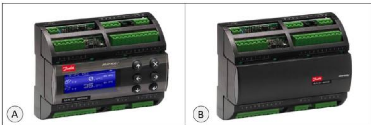
Рис. 1 Внешний вид контроллера ЕКЕ: А) – с ЖК дисплеем; В) – без ЖК дисплея

Контроллер ЕКЕ выполнен в одном корпусе (см. рис.1).