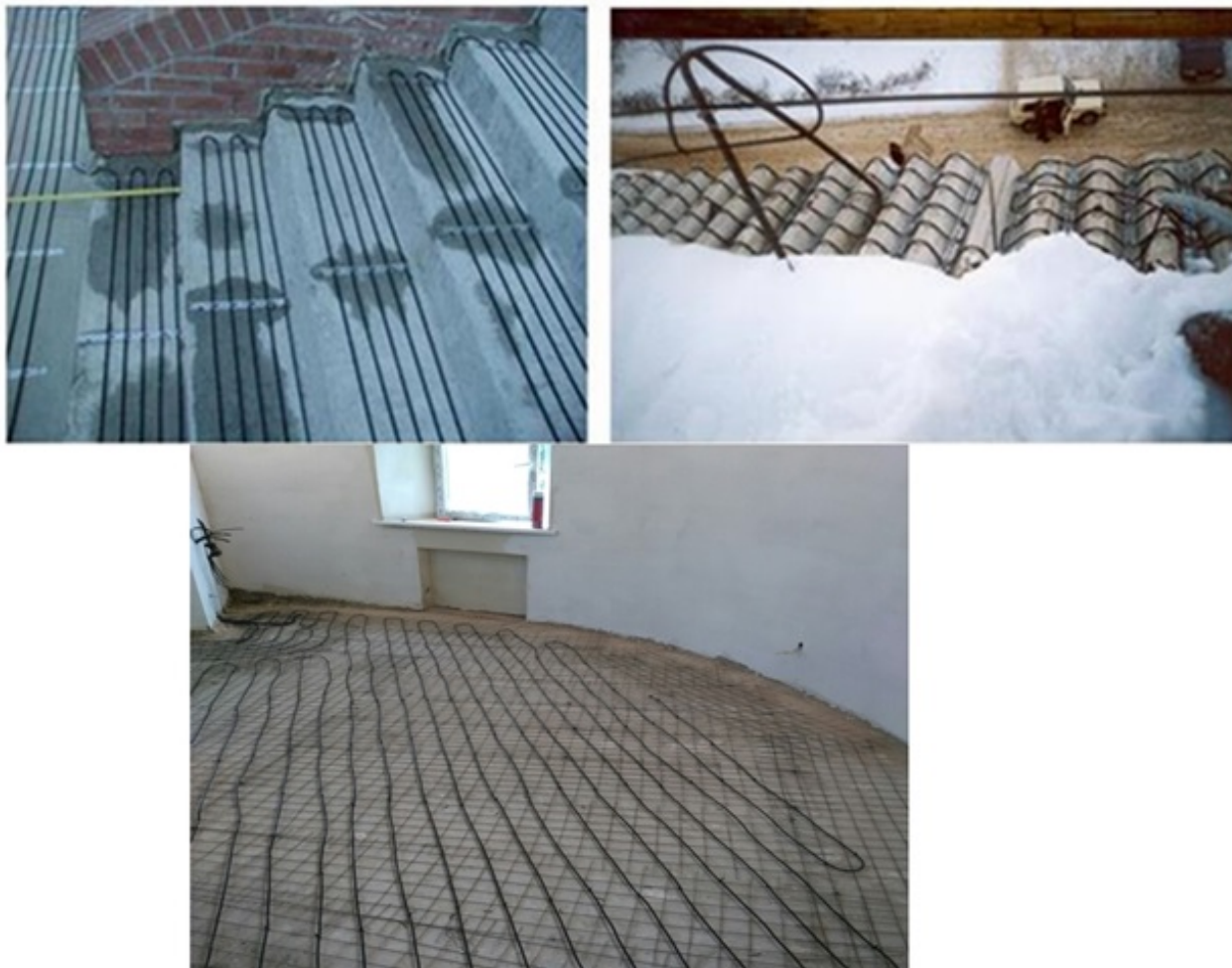
Рис. 3. Монтаж нагревательного кабеля DEVI safe™ 20T на лестнице, на крыше и в конструкции «Тёплого пола»

Примеры установки нагревательного кабеля приведены на Рис.3