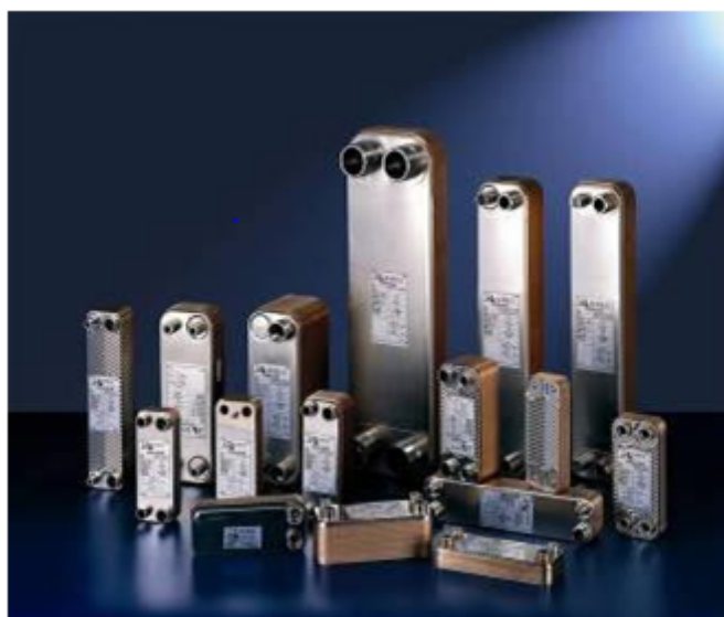
Внешний вид теплообменников пластинчатых типа ВРНЕ

Теплообменники пластинчатые типа ВРНЕ предназначены для передачи тепловой энергии от одного теплоносителя к другому. Теплообменники пластинчатые типа ВРНЕ могут применяться в холодильных установках (компрессорных, абсорбционных), а также в тепловых насосах. В качестве рабочих сред могут использоваться негорючие хладагенты (фторуглеводороды, хлорфторуглеводороды, аммиак, CO 2 ), технические и холодильные масла, вода для технических нужд и систем ГВС, спиртосодержащие растворы.