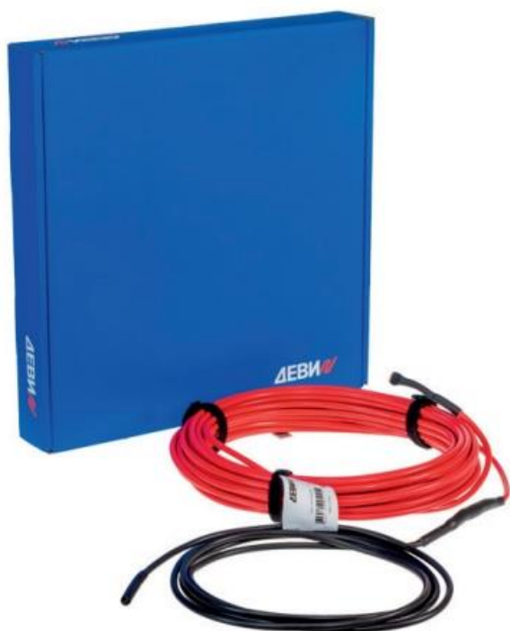
Рис. 1. Внешний вид нагревательного кабеля ДЕВИ Flex-18Т .