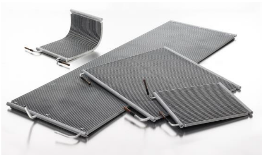
Внешний вид теплообменников микроканальных типа МСНЕ

Теплообменники микроканальные типа МСНЕ предназначены для передачи тепловой энергии от одного теплоносителя к другому в системах холодоснабжения и кондиционирования воздуха. Теплообменники МСНЕ могут использоваться в качестве конденсаторов для бытовых и коммерческих систем кондиционирования воздуха, а также в холодильном оборудовании для стандартных хладагентов (фторуглероды, хлорфторуглероды, гидрофторуглероды, такие как R410A, R407C, R134a и т. д. - жидкости группы рабочих сред 1, 2 и газы группы рабочих сред 2, согласно ТР ТС 032/2013), в качестве конденсаторов для аммиачных систем (полностью алюминиевый дизайн, включая патрубки) и как теплообменники для систем фрикулинга, работающих с водой или теплоносителями на основе гликолей (пропиленгликоль, этиленгликоль и производные). Микроканальная технология также может быть использована для испарителей, радиаторов и реверсивных систем, если такое применение предусмотрено назначением каждого конкретного теплообменника.