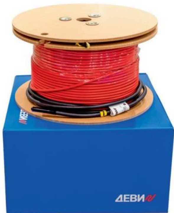
Рис. 1. Внешний вид нагревательного кабеля ДЕВИ Flex-10T на катушке и упаковочной коробке.

Нагревательный кабель ДЕВИ Flex-10T (Рис.1) применяется для внутренней и наружной установки. Кабель используется для полного отопления или комфортного подогрева поверхности пола при монтаже деревянных полов на лагах или ремонтируемых и тонких бетонных полов. В наружных установках используется для защиты от замерзания грунта под холодильными камерами и искусственными катками, а также для сопровождающего обогрева трубопроводов и обогрева уличных резервуаров.