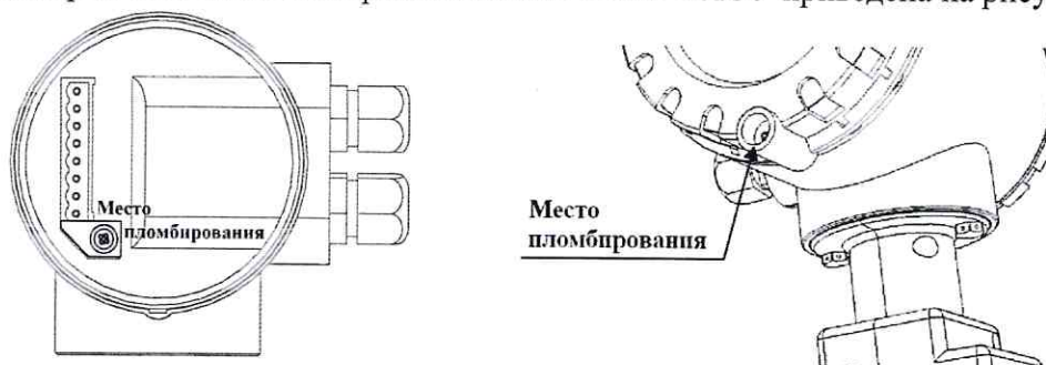
а) исполнение РС, исполнение СВ

Пломбировка расходомеров-счетчиков электромагнитных ПИТЕРФЛОУ осуществляется нанесением знака поверки давлением на специальную мастику, расположенную в чашечке винта крепления на лицевой части передней панели электронного блока и внутри электронного блока, в соответствии с рисунком 2. Схема пломбировки расходомеров-счетчиков электромагнитных ПИТЕРФЛОУ приведена на рисунке 2.