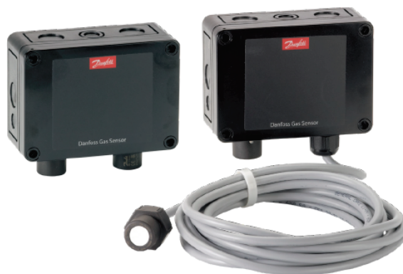
Рисунок 1 – Общий вид детектора газа типа DGS (IP65)

Детекторы газа типа DGS оснащены материнской платой и сменным измерительным датчиком. Материнская плата одинакова во всех детекторах газов, независимо от типа хладагента и способа измерения концентрации газа. Материнскую плату можно настраивать под условия эксплуатации.