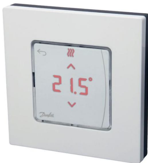
Danfoss Icon ™ Wireless Display IR, Danfoss Icon ™ Wireless Display

Комнатный термостат применяется для управления системой водяных теплых полов. Обеспечивает регулирование комнатной температуры в соответствии с потребностями пользователя, энергосбережение и комфорт.