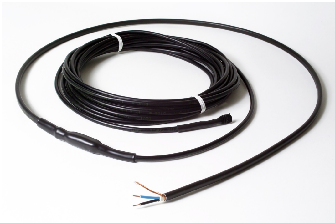
Рис. 1. Нагревательный кабель DEVIsnow™ 30T. Области применения нагревательного кабеля DEVIsnow™ 30T.

Нагревательный кабель DEVIsnow™ 30T (далее – кабель) (Рис. 1) применяется для наружной установки и используется в основном для систем стаивания снега и льда на крышах, а также обогрева открытых площадок (Таблица 1). Может быть также использован в системах «Тёплый пол» и для подогрева травяных газонов. Поставляется в виде готовых нагревательных секций с установленными соединительной и концевой муфтами.