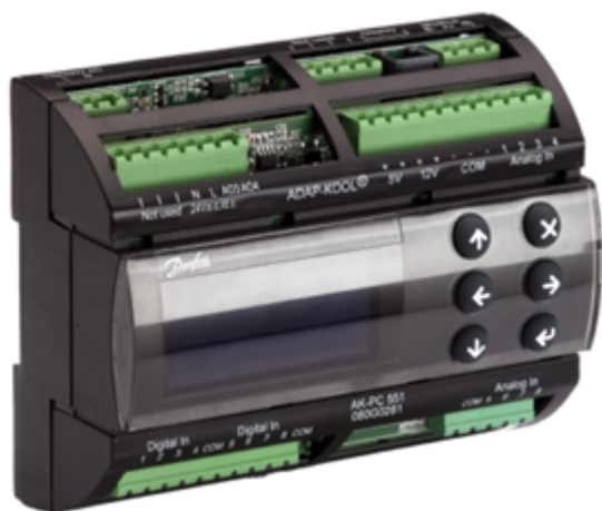
Рис. 1 Внешний вид контроллера

Контроллеры давления и температуры типа АК-РС модификации 551 выполнены в одном корпусе и могут иметь встроенный графический дисплей. Для настройки и отображения параметров к контроллерам можно подключить выносные дисплеи.