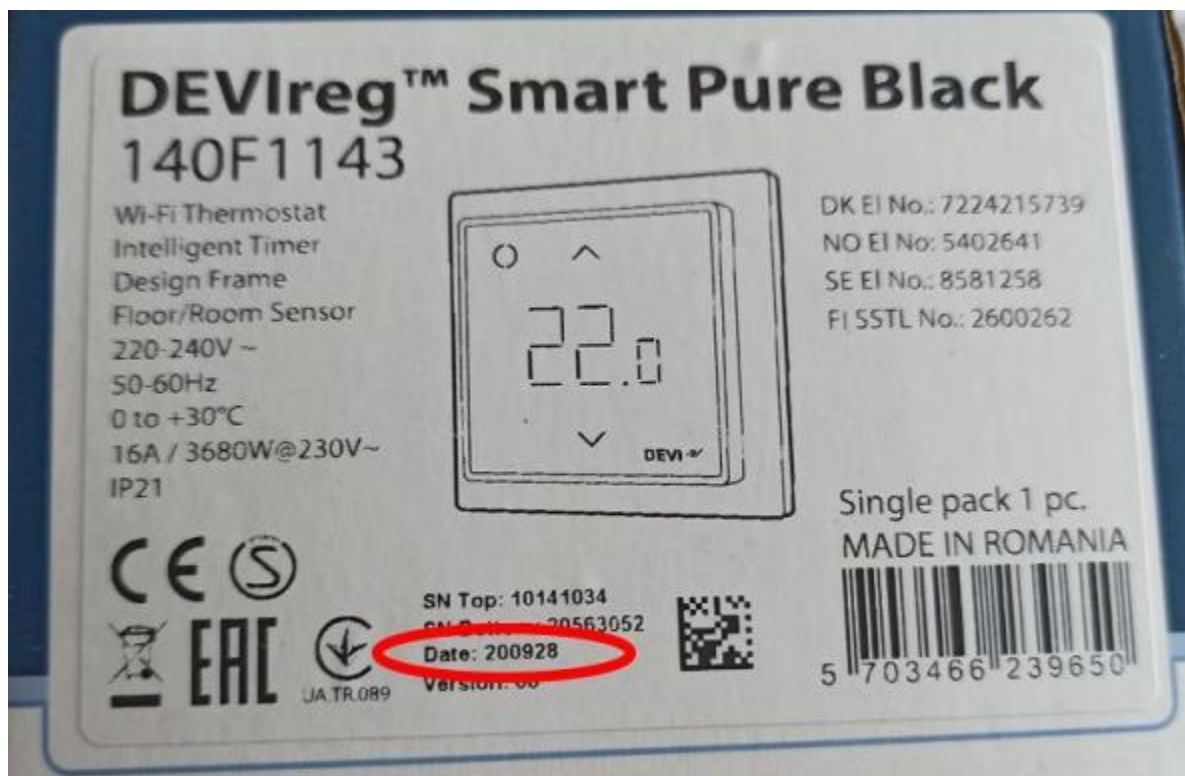
Рис. 1А. Вид стикера на упаковочной коробке терморегулятора.

Дата изготовления указана на стикерах, расположенных на упаковочной коробке (Рис. 1А), а также на внутренней поверхности модуля индикации терморегулятора (Рис. 1Б).