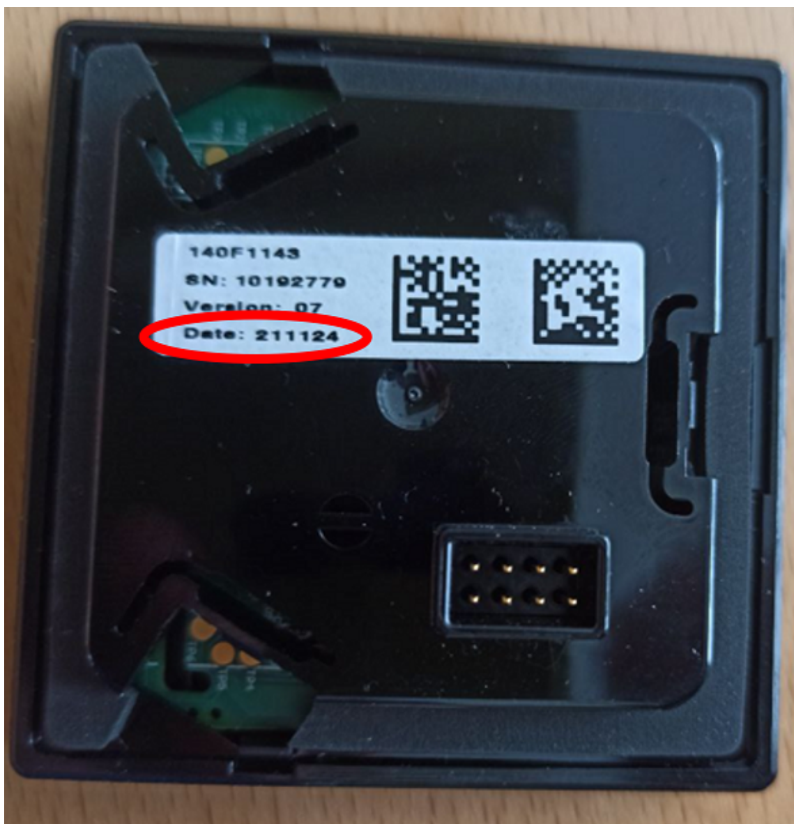
Рис. 1Б. Вид стикера на корпусе модуля индикации терморегулятора.