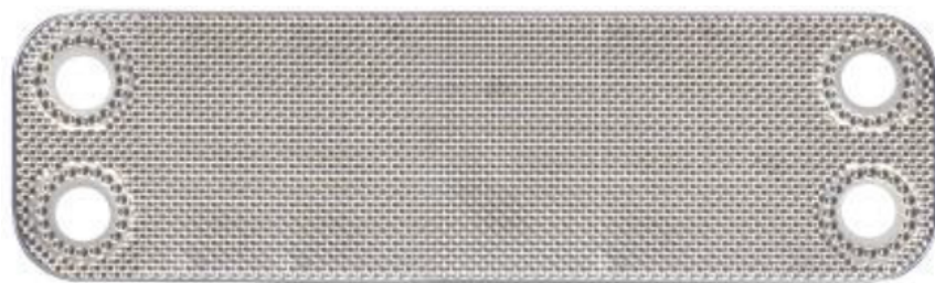
Внешний вид теплообменных пластин.