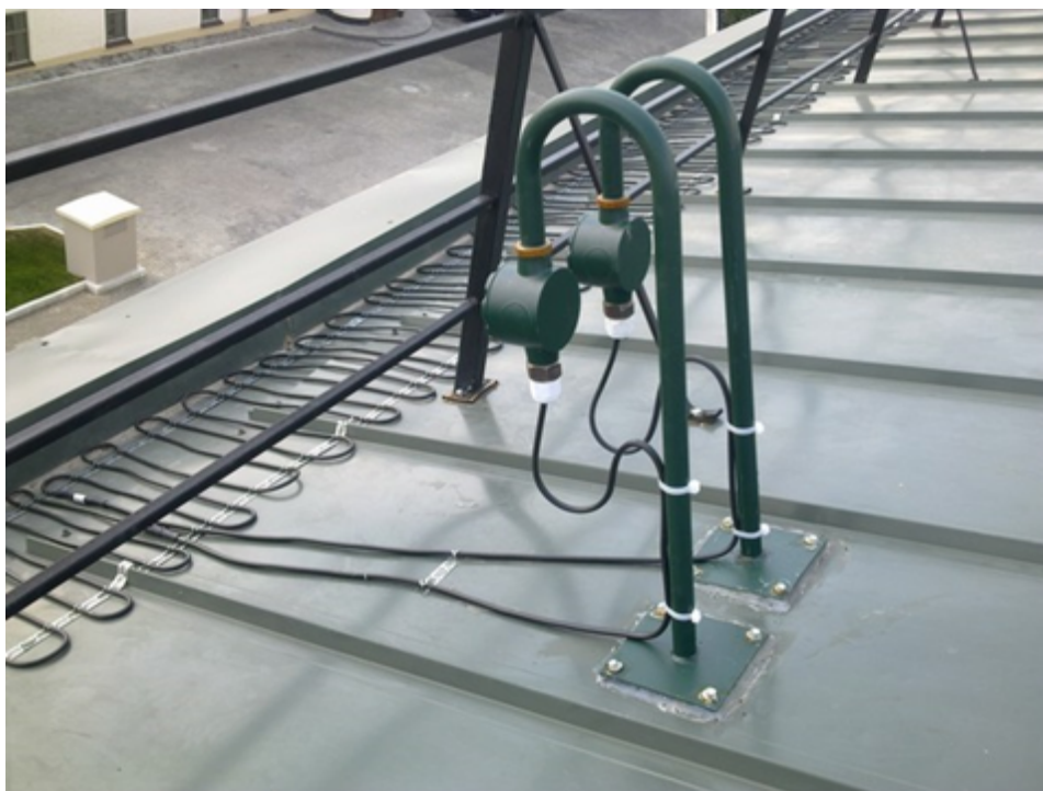
Рис. 3. Монтаж нагревательного кабеля на крыше. DEVIsnow™ 30T