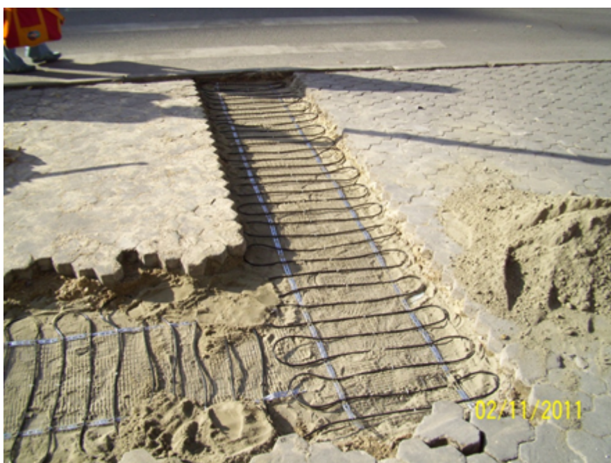
Рис. 4. Монтаж нагревательного кабеля DEVIsnow™ 30T для обогрева пешеходной зоны.