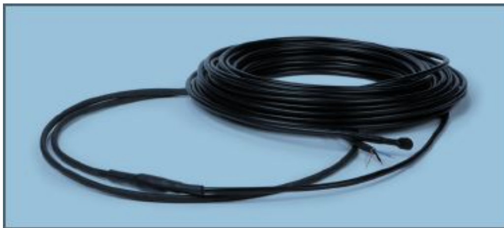
Рис. 1. Нагревательный кабель DEVI safe™ 20T.

Кабель может быть использован для обогрева металлических трубопроводов, в системах «Тёплый пол» и для подогрева травяных газонов. Поставляется в виде готовых нагревательных секций с установленными соединительной и концевой муфтами.