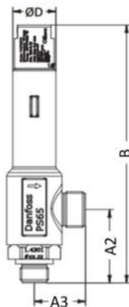
Рис. 2 Условные обозначения геометрических параметров

Дополнительные технические характеристики