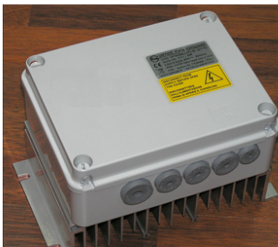
Рис. 1 Внешний вид регулятора скорости вращения вентиляторов типа ACCSCS