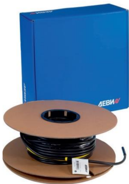
Рис. 1. Нагревательная секция кабеля ДЕВИ Snow-30T .

Нагревательный кабель ДЕВИ Snow-30T (далее – кабель) (Рис. 1) применяется для наружной установки и используется в основном для систем стаивания снега и льда на крышах, а также для обогрева открытых площадок (Таблица 1). Кабель может быть использован для подогрева травяных газонов. Изделие поставляется в виде готовых к установке заводских нагревательных секций с подсоединённым кабелем питания длиной 4 м. Номенклатура нагревательных секций, предназначенных для питания от электросети переменного тока 230 В, включает 17 типоразмеров длины, от 10 м до 140 м.