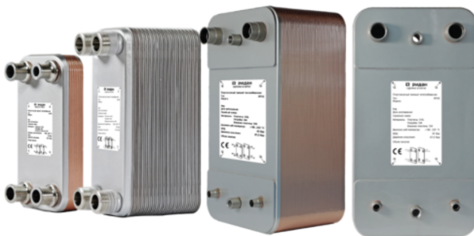
Рис.1 - Внешний вид теплообменников пластинчатых типа ВРНЕ

Теплообменники пластинчатые типа ВРНЕ предназначены для передачи тепловой энергии от одного теплоносителя к другому. Теплообменники пластинчатые типа ВРНЕ могут применяться в холодильных установках (компрессорных, абсорбционных), а также в тепловых насосах. В качестве рабочих сред могут использоваться негорючие хладагенты (фторуглероды, хлорфторуглероды, аммиак, CO 2 ), технические и холодильные масла, вода для технических нужд и систем ГВС, спиртосодержащие растворы.