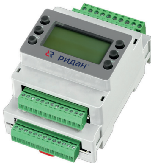
Рис. 1 Внешний вид контроллера

Контроллеры производительности типа Р-КП модификации 301 выполнены в одном корпусе со встроенным графическим дисплеем.