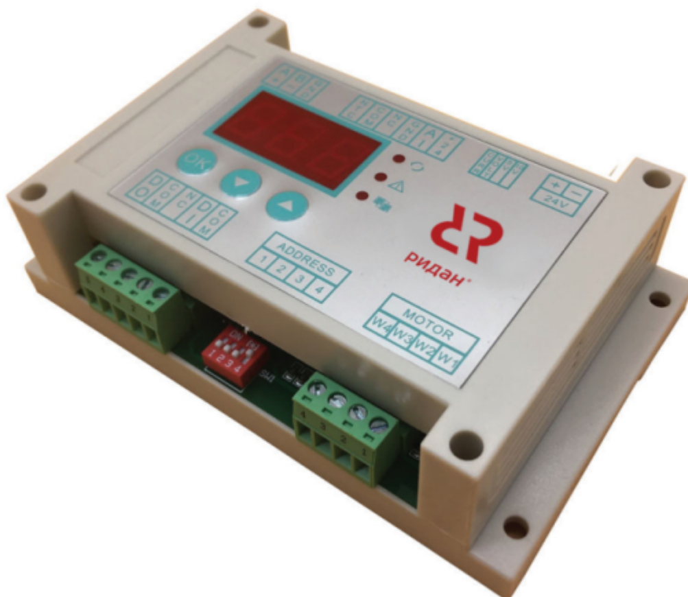
Рис. 1 Внешний вид контроллера

Контроллер типа Р-КИ выполнен в одном корпусе. Для настройки и отображения параметров используется встроенный дисплей.