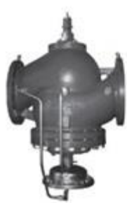
Д н = 200-250 мм

Клапан балансировочный типа AQF (далее – AQF) – автоматический балансировочный клапан, стабилизатор расхода. Основные области применения: ограничение и стабилизация расхода в системах с постоянными гидравлическими характеристиками, например в однетрубных стояках систем отопления или в системах холодоснабжения установок кондиционирования воздуха.