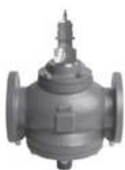
Д н = 50-100 мм