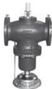
Д н = 125-150 мм