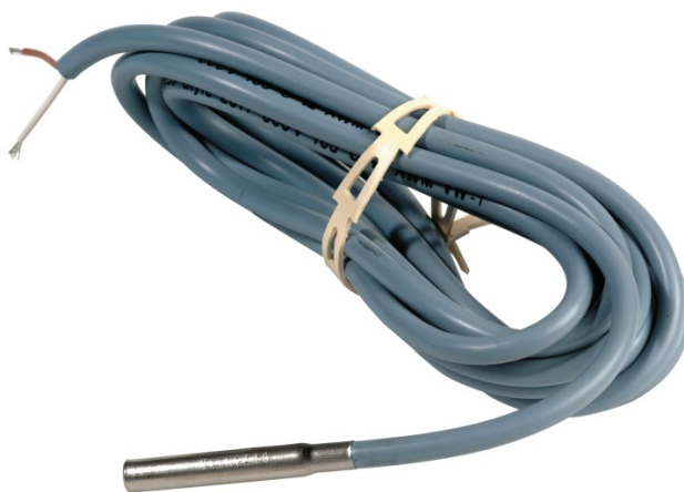
Общий вид датчика температуры типа ESMB-12

Датчик температуры типа ESMB-12, представляющий собой платиновый термометр сопротивления (1000 Ом при 0 °С), применяется для управления и индикации температуры теплоносителя в системах отопления, охлаждения, горячего и холодного водоснабжения, вентиляции и кондиционирования. Датчики температуры типа ESMB-12 являются двухпроводными устройствами с симметричной схемой включения.