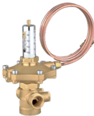
АРТ-R Ду 15-50