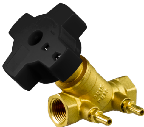
Рис. 1 Общий вид клапана типа MNT, модификация MNT-R

Клапаны балансировочные типа MNT, модификация MNT-R (далее – клапан MNT-R) предназначены для использования в системах отопления и охлаждения зданий. Их следует устанавливать, как правило, в системах с постоянными гидравлическими характеристиками.