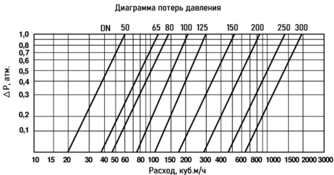
Диаграмма потерь давления в полностью открытом регуляторе

Потери давления при проходе рабочей среды через регулятор могут быть определены по диаграмме: