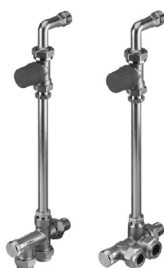
С никелем подключением