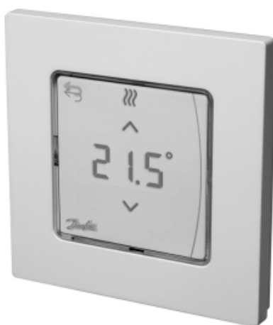
Danfoss Icon™ Display

Комнатный термостат типа Danfoss Icon Display применяется для управления системой водяных теплых полов. Обеспечивает регулирование комнатной температуры в соответствии с потребностями пользователя, энергосбережение и комфорт.