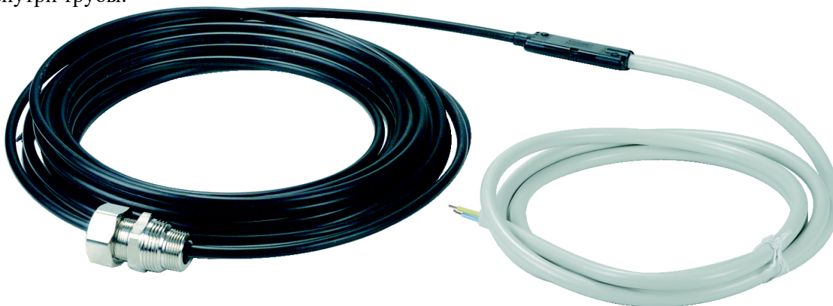
Рис. 1. Внешний вид нагревательного кабеля DEVIaqua™ 9T с уплотнительной муфтой.

Поставляется в комплекте с установленной на кабеле специальной уплотнительной муфтой на 2 типа трубной резьбы: 3/4” и 1”. Обладает достаточной жесткостью, которая упрощает прокладку кабеля внутри трубы.