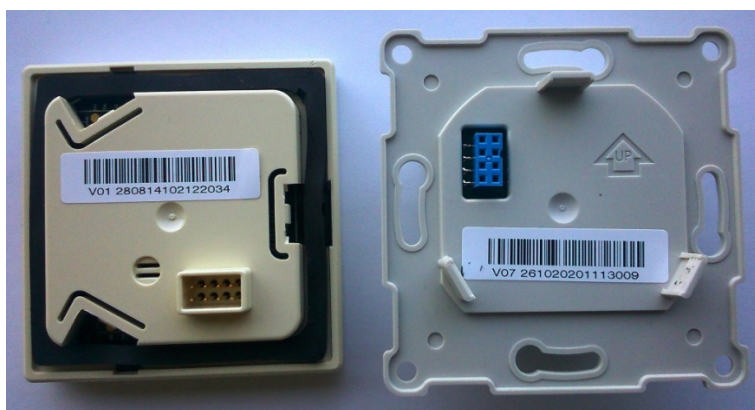
Рис. 1. А. Вид стикеров на корпусе модуля индикации и на модуле питания терморегулятора.

Дата изготовления указана на стикерах, расположенных на внутренних поверхностях модуля питания и модуля индикации терморегулятора, а также на упаковочной коробке (Рис. 1).