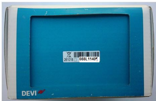
Б. Вид стикера на упаковочной коробке терморегулятора.