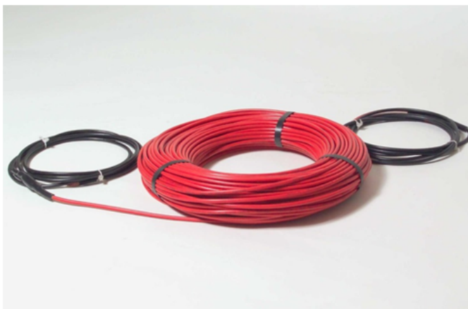
Рис. 1. Нагревательный кабель DEVIbasic™ 10S .

Нагревательный кабель поставляется в виде готовых нагревательных секций фиксированной длины, рассчитанных на напряжение питания 230 В, с двумя холодными питающими кабелями с герметичными переходными муфтами.