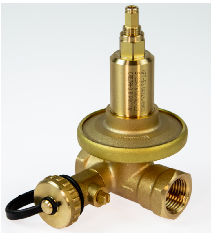
Рис. 1 - Внешний вид клапана АРТ-R3

Клапаны АРТ-R3 - регуляторы постоянства перепада давлений, предназначенные для гидравлической балансировки трубопроводных систем тепло- и холодоснабжения при переменных расходах проходящей через них среды в диапазоне от 0 до 100% (Рис.1). Не предназначены для контакта с питьевой водой в системах хозяйственно-питьевого водоснабжения.