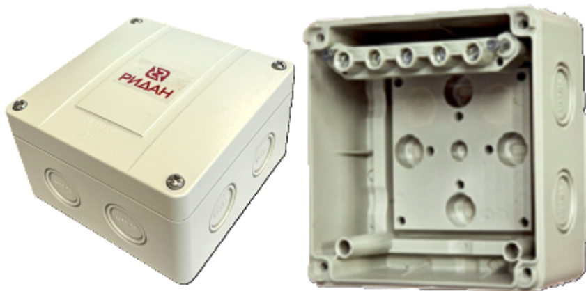
Рис. 1 - Внешний вид коробки Ridan M BOX