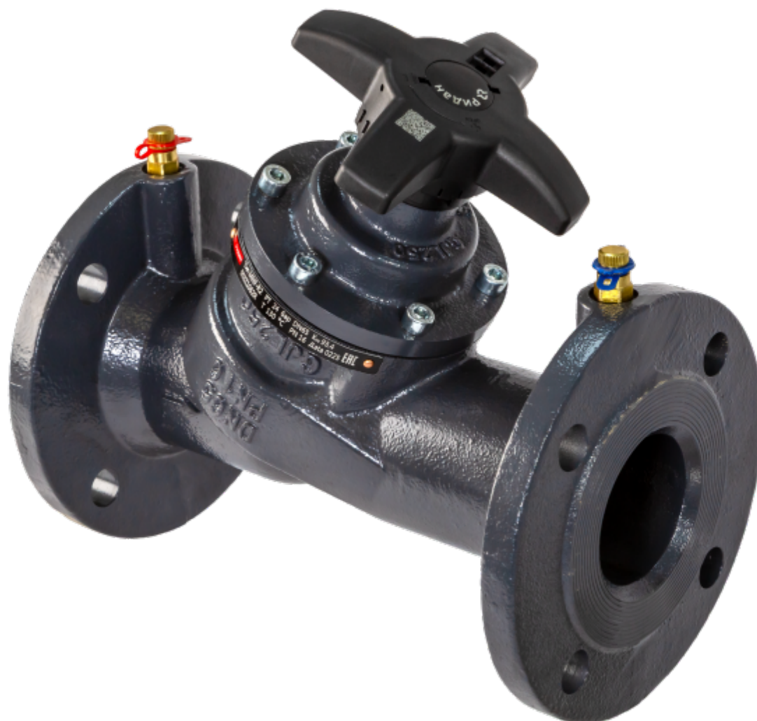
Рис. 1 Общий вид клапана типа MNF, модификация MNF-R2

Клапаны балансировочные типа MNF, модификация MNF-R2 (далее – клапан MNF-R2) используются для монтажной наладки трубопроводных систем тепло - и холодоснабжения зданий и сооружений с целью обеспечения в них расчетного потокораспределения.