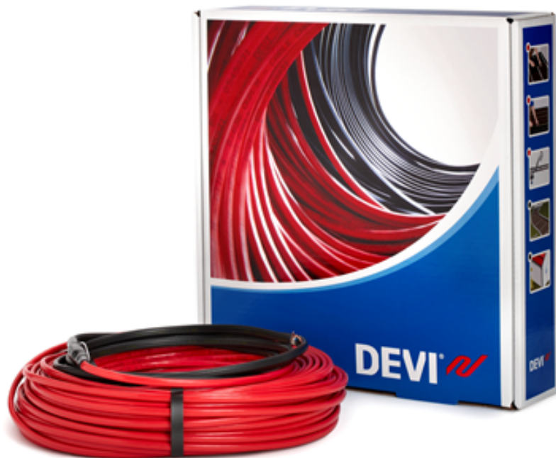
Рис. 1. Внешний вид нагревательного кабеля DEVIflex™ 18Т с упаковочной коробкой.