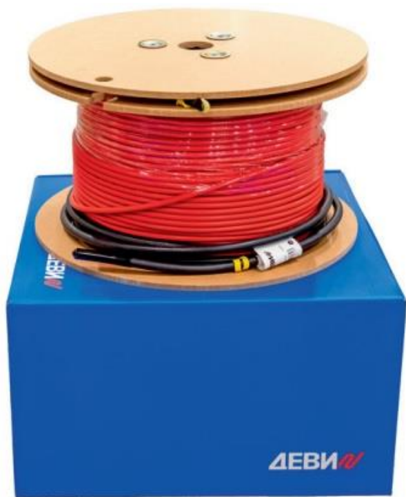
Рис. 1. Внешний вид нагревательного кабеля ДЕВИ Flex-10T на катушке и упаковочной коробке.

Нагревательный кабель ДЕВИ Flex-10T (Рис.1) применяется для внутренней и наружной установки. Кабель используется для полного отопления или комфортного подогрева поверхности пола при монтаже деревянных полов на лагах или ремонтируемых и тонких бетонных полов. В наружных установках используется для защиты от замерзания грунта под холодильными камерами и искусственными катками, а также для сопровождающего обогрева трубопроводов и обогрева уличных резервуаров.