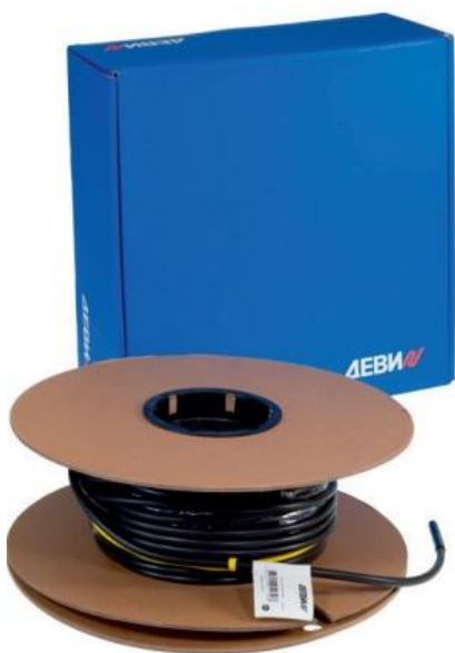
Рис. 1. Нагревательная секция кабеля ДЕВИ Snow-30T .

Нагревательный кабель ДЕВИ Snow-30T (далее – кабель) (Рис. 1) применяется для наружной установки и используется в основном для систем стаивания снега и льда на крышах, а также для обогрева открытых площадок (Таблица 1). Кабель может быть использован для подогрева травяных газонов. Изделие поставляется в виде готовых к установке заводских нагревательных секций с подсоединённым кабелем питания длиной 4 м. Номенклатура нагревательных секций, предназначенных для питания от электросети переменного тока 230 В, включает 17 типоразмеров длины, от 10 м до 140 м.